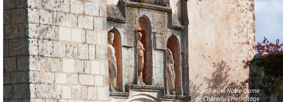
Le prieuré Notre-Dame de Château-l'Hermitage