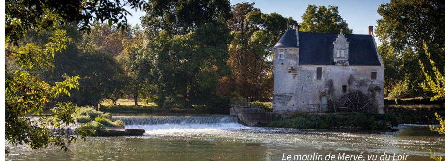
Le moulin de Mervé, vu du Loir