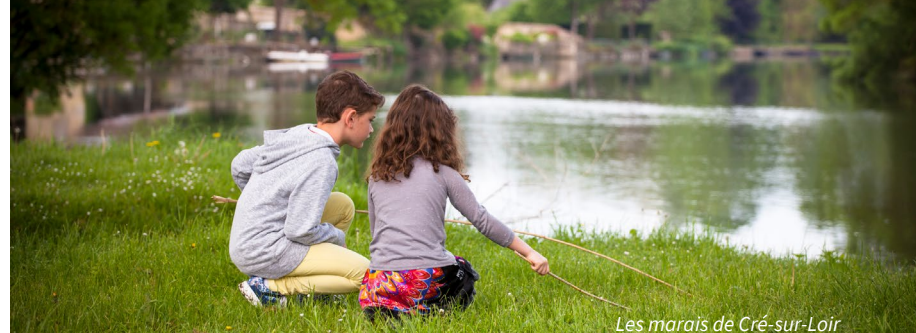
Les marais de Cré-sur-Loir