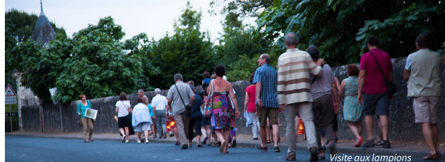
Visite aux lampions